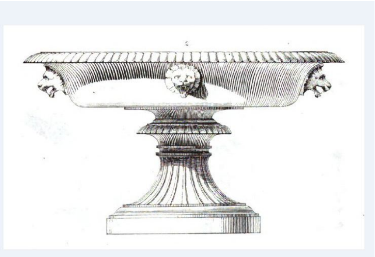
ZDJĘCIE WAZY - ORYGINAŁ STOJĄCY W ZATONIU NA POCZĄTKU XX WIEKU.